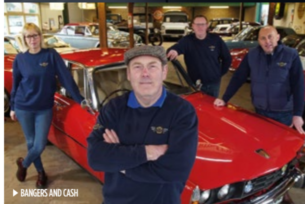
► BANGERS AND CASH