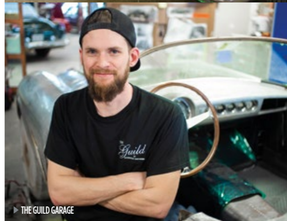
► THE GUILD GARAGE