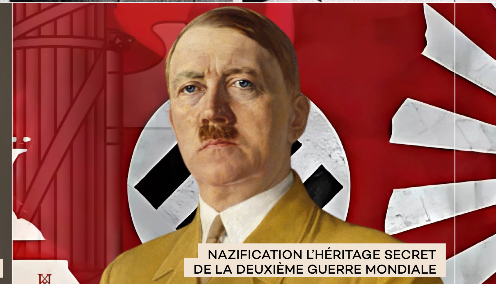
NAZIFICATION L'HÉRITAGE SECRET DE LA DEUXIÈME GUERRE MONDIALE