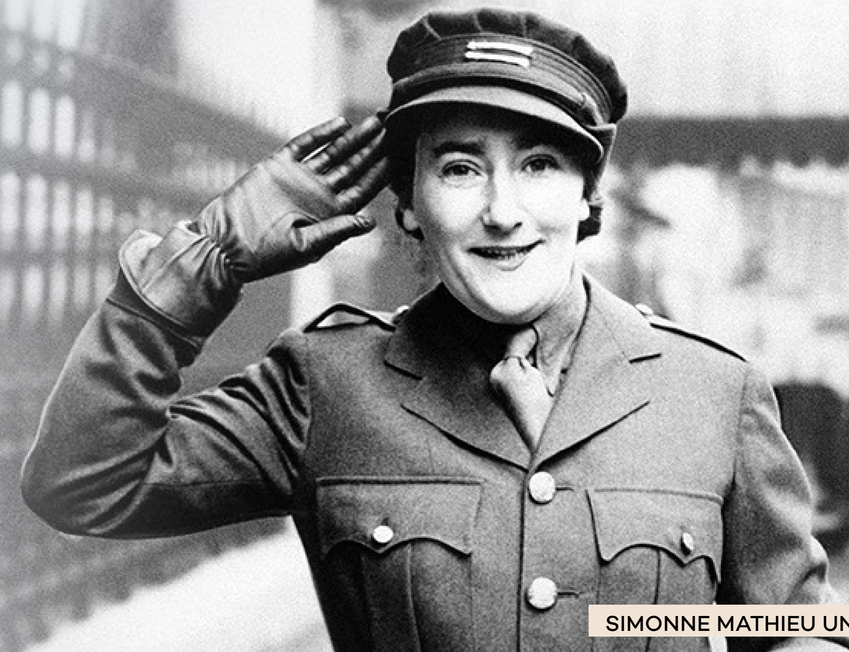
SIMONNE MATHIEU UNE COMBATTANTE

Enquêtes, témoignages, récits, la chaîne revient sur les grands conflits et décrypte les évolutions de la société. Elle pose un regard singulier sur l'Histoire de France et du monde.