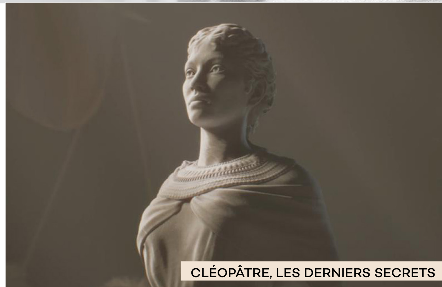
CLÉOPÂTRE, LES DERNIERS SECRETS